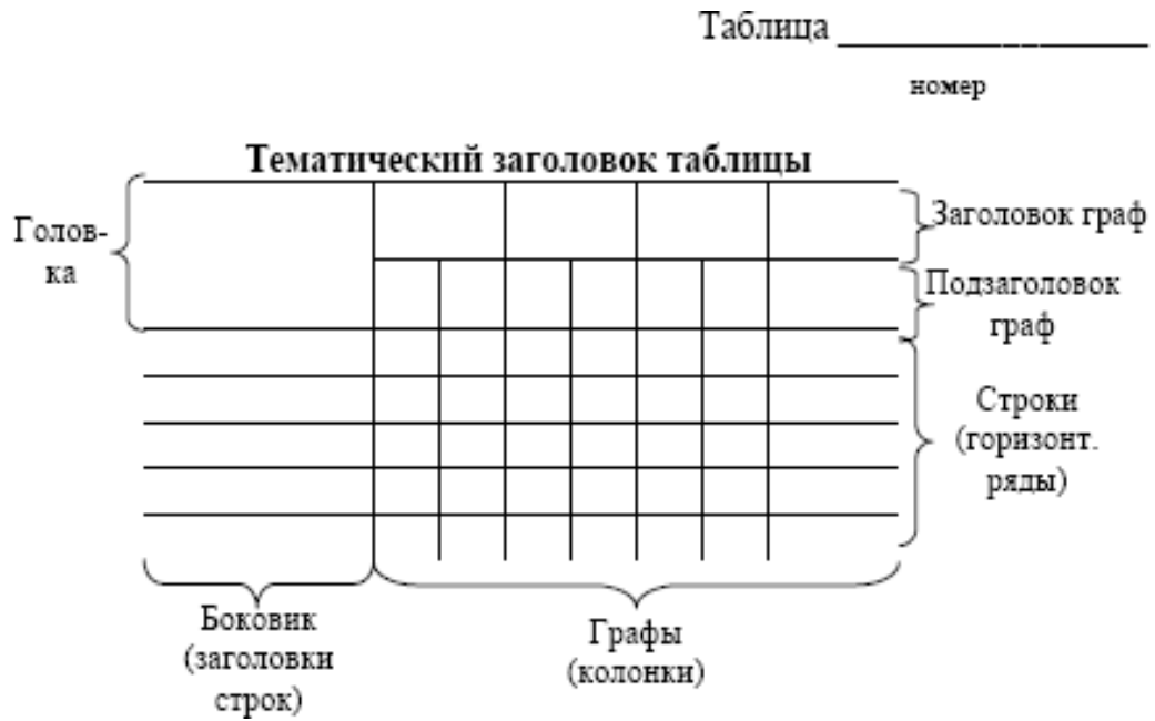
Рис. 1. Структура таблицы