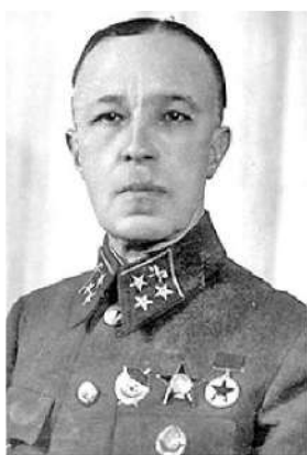
Герой Советского Союза Д.М. Карбышев.

Генерал-лейтенант С.И. Горшков , генерал Д. М. Карбышев , адмирал А. Г. Головко , Образцы военно – патриотической культуры представителей казачества воплотились и в сфере оружейного искусства, ярким деятелем которого стал всемирно известный мастер Ф.В. Токарев .