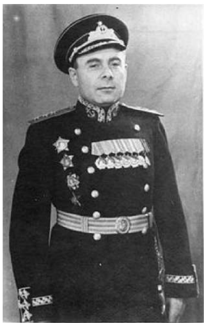
Адмирал А.Г. Головко

А.Г.Головко — выдающийся советский флотоводец, адмирал (1944), бессменный командующий Северным морским флотом во время Великой Отечественной войны.