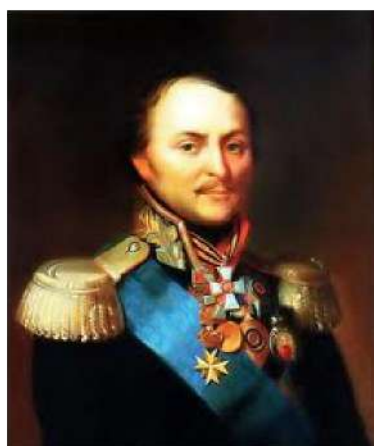
Генерал от кавалерии М.И. Платов