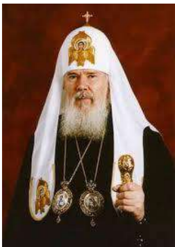
Святейший Патриарх Алексий II

Значительную роль в возрождении и охране Свято-Данилова монастыря в Москве сыграло казачество . В 1992 году был отслужен первый молебен на создание казачьей охраны в Покровском храме обители. В напряженные октябрьские дни 1993 года стража в полном составе обеспечивала безопасность переговоров между представителями администрации Президента Ельцина и Верховного Совета, проходивших в Патриаршей резиденции монастыря. Совместно с ОМОНОм казаки пресекли попытку вооруженной толпы завладеть автотранспортом в гаражах обители. В мае 1996 г. со Святой Горы Афон в обитель доставили мощи великомученика Пантелеимона . Казачья охрана несла службу, помогая многочисленным паломникам организованно приложиться к святыне. В 1998 году охрана участвовала в перенесении мощей святого преподобного Саввы Сторожевского и блаженной Матроны Московской . В 1999 году была организована казачья охрана в монастырском скиту преподобного Сергия Радонежского в Рязанской области. А в 2002 году, по случаю 10-летия охраны, Святейший Патриарх Алексий II лично провел награждение руководящего состава казачьими памятным крестами.