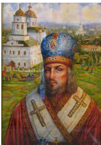
Святитель Иоасаф Белгородский

В плеяду русских святых из казачьих родов, своей пастырской деятельностью и богословским литературным творчеством ознаменовавший эпоху императрицы Елизаветы Петровны, вошел епископ Белгородский Иоасаф (1705–1754).