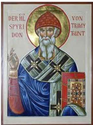
Святитель Спиридон Тримифунтский

В юбилейный 2003 год стража доблестно несла службу на торжествах по случаю 700-летия кончины святого Даниила Московского и 100-летия канонизации преподобного Серафима Саровского в Дивееве, куда несколько казаков из охраны отправились по собственной инициативе. В трагические августовские дни после гибели лидера-идеолога Союза казаков полковника Владимира Наумова в 2004 году от рук наемных убийц казаки стражи охраняли членов его семьи. В 2007-2008 гг. стража участвовала в охранных мероприятиях по случаю возвращения древних Даниловских колоколов из Гарварда (США) в обитель святого Даниила – это событие стало значимым не только для монастыря, но и для всей России. В октябре 2010 года казаки обеспечивали охрану монастыря при прибытии из Греции святых мощей святителя Спиридона Тримифунтского .