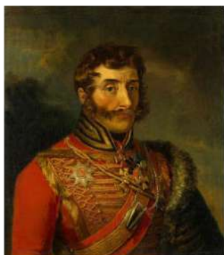
Генерал-лейтенант И.С. Дорохов

Своими подвигами прославлено казачество в годы Великой Отечественной войны и послевоенный период: