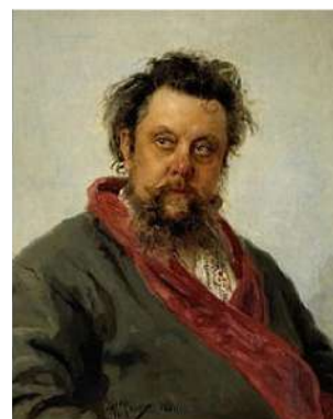
И.Е. Репин. Портрет М.П. Мусоргского

В Советском Союзе главным авторитетом по казачьей теме был, конечно, М. А. Шолохов . Его роман «Тихий Дон» стал и в России, и далеко за ее пределами самым знаменитым произведением о казачестве. Этот факт примечателен и тем, что в советское время тема казачества не являлось предметом самостоятельного рассмотрения, а слова «казак», «казачество», как правило, заменяло понятие «народ». Но самобытность, колорит и достоверность в изображении донских казаков в Шолохова существенно обогащают представления о казачестве. В его описании казаки предстают деятельными и умелыми организаторами, с мужественными, сильными характерами, не лишенными и человеческих слабостей, но искренними и самоотверженными борцами за справедливость.