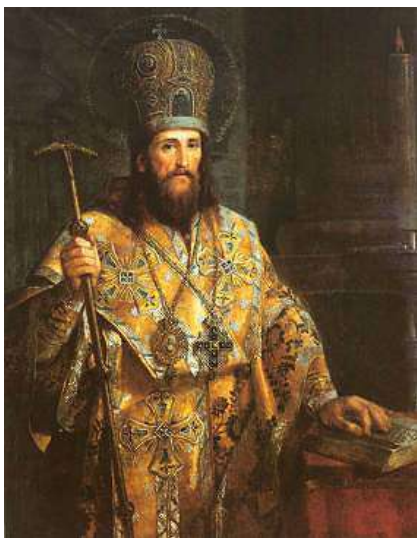
Святитель Димитрий Ростовский

блестяще проявил себя еще один выдающийся деятель, выходец из среды казачества, святитель Димитрий Ростовский .