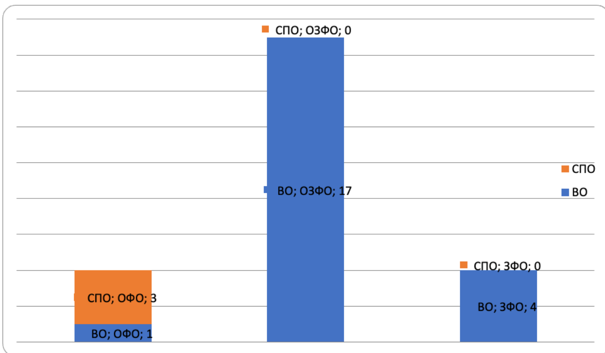
Рисунок Численность иностранных граждан, обучающихся по программам ВО и СПО по формам обучения, чел.

В региональном институте ведется подготовка обучающихся, как на бюджетной, так и на внебюджетной основе: