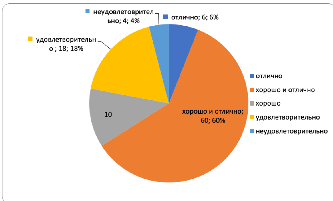
Рисунок Диаграмма распределения оценок по итогам проведения летней промежуточной аттестации (СПО), %.

На рисунке показана диаграмма распределения оценок по итогам проведения летней промежуточной аттестации 2022/2023 учебного года студентов, обучающихся по программам среднего профессионального образования: