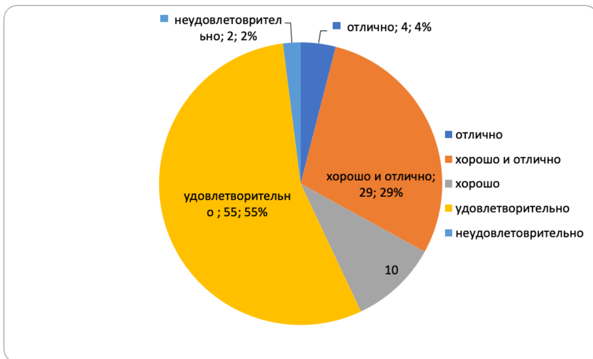
Рисунок Диаграмма распределения оценок по итогам проведения летней промежуточной аттестации (ВО), %.

На рисунке показана диаграмма распределения оценок по итогам проведения летней промежуточной аттестации 2022/2023 учебного года студентов, обучающихся по программам среднего профессионального образования: