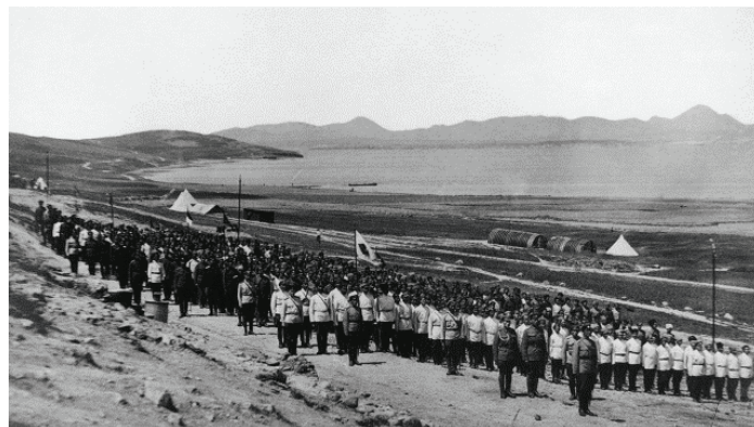
Смотр 5-го Донского Платовского полка. Весна 1921 г

В июне 1921 г. генерал Ф.Ф. Абрамов в своем лемноском дневнике так выразит мысли, ставшие на острове кредо большинства русских изгнанников: «Единственный путь — правильный путь — открытая,