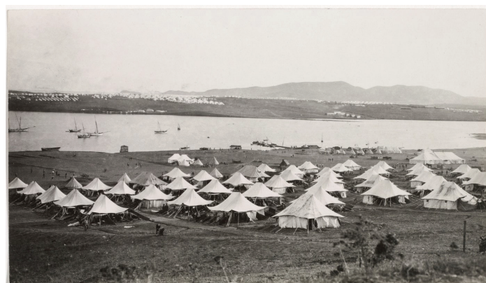
Вид на казачий лагерь на острове Лемнос.

с высоко поднятыми монархическими знаменами, борьба против революции и в первую голову против подготовленных ею большевиков. Не чужими руками, не обманом, грабежом и насилием, а путем покаяния, самопожертвования и правды. Вот путь великого примирения народа с Царем. В покаянии, смирении и примирении народа с законной властью Царя — спасение и возрождение России».