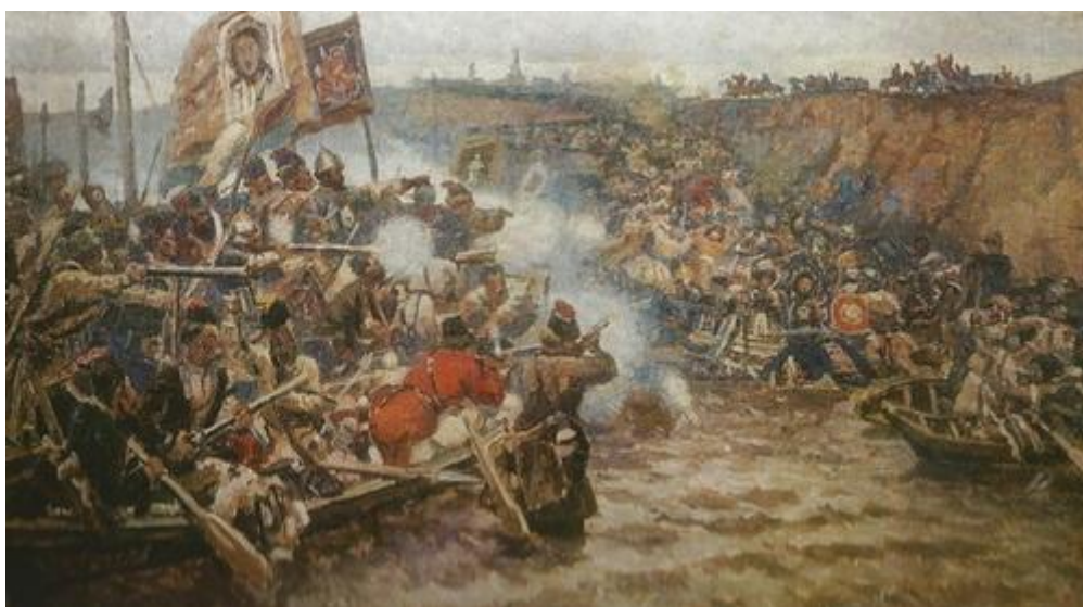
Суриков В. И. Покорение Сибири Ермаком

Первые упоминания о военных походах Ермака относятся к 60-м годам 16 века. Вольные казаки в то время участвовали в самых значительных военных событиях. Так, согласно летописям, Ермак со своей дружиной под стенами Москвы воевал против крымского хана Давлет-Гирея. Известно также, что в течение почти двадцати лет защищал он южные границы России от татарских набегов. Вот как описывает черты характера Ермака Тимофеевича А.Н. Радищев в очерке «Слово о Ермаке»: «Ермак, избранный единожды верховным начальником своею собратею, умел над ними удержать свою власть...Чтобы властвовать над множеством, нужно величие духа или же изящность почитаемого какого-либо качества, Ермак имел первое и многие из тех свойств, которые нужны воинскому вождю, а паче вождю непорабощенных воинов».