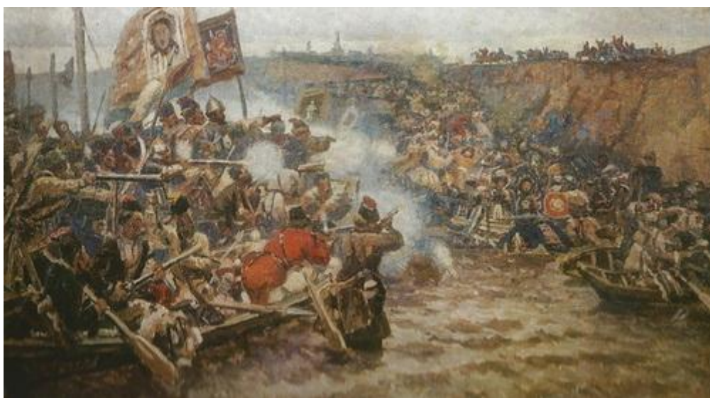
Суриков В. И. Покорение Сибири Ермаком

Первые упоминания о военных походах Ермака относятся к 60-м годам 16 века. Вольные казаки в то время участвовали в самых значительных военных событиях. Так, согласно летописям, Ермак со своей дружиной под стенами Москвы воевал против крымского хана Давлет-Гирея. Известно также, что в течение почти двадцати лет защищал он южные границы России от татарских набегов. Вот как описывает черты характера Ермака Тимофеевича А.Н. Радищев в очерке «Слово о Ермаке»: «Ермак, избранный единожды верховным начальником своею собратею, умел над ними удержать свою власть...Чтобы владычествовать над множеством, нужно величие духа или же изящность почитаемого какого-либо качества, Ермак имел первое и многие из тех свойств, которые нужны воинскому вождю, а паче вождю непорабощенных воинов».